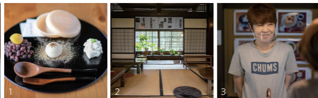
1.クリームチーズとあんこのもなか500円。和洋折衷の味を楽しめる。 2.古民家は落ち着いた雰囲気。3.優しい笑顔のオーナーにほっこり。