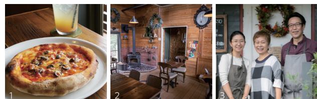
1.カボナータ1,760円。素材にこだわったピザは1つ1つ石窯で焼いています。 2.ロジック調のおしゃれな店内。3.オーナー親子はみんな仲良し。

福井県南条郡南越前町今庄76-31 営/11:00~17:00 休/月・火 問/0778-45-1112