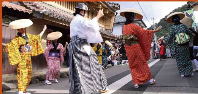
羽根曾踊り 宿場町として栄えた今庄の、旅人とともに踊り明かしたといわれる風情ある優雅な盆踊りは一見の価値あります。会場：公徳園