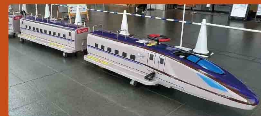
ミニ北陸新幹線 ※1周 100円