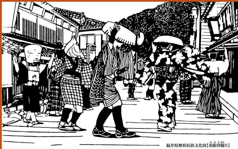
福井県無形民俗文化財【羽根曾踊り】

主催：街道浪漫 今庄宿2023実行委員会 お問い合わせ：今庄観光協会 0778-45-0074